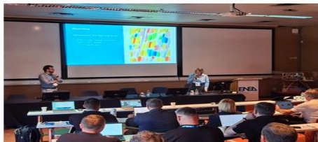
Opening of the training curriculum validation workshop.