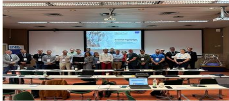
Group photo of the CBRNe4rail consortium at ENEA headquarters in Frascati (Italy).