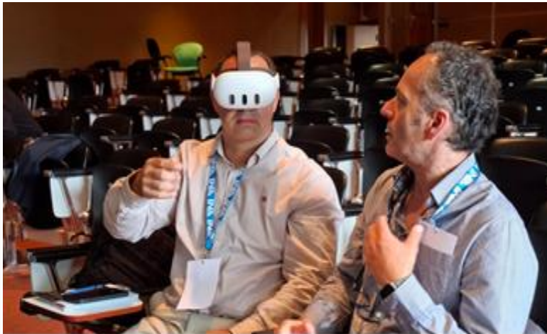
Наочаре за виртуелну реалност

У оквиру пројекта ЕУ CBRNe4Rail, који координира Одељење за безбедност Међународне железничке уније ( UIC ), од 11. до 13. маја у Центру за истраживања ENEA у Риму одржан је други састанак посвећен праћењу напретка пројекта. Партнери су се окупили како би размотрили досадашња достигнућа, потврдили кључне техничке резултате и координисали наредну фазу рада на јачању отпорности железничког система на хемијске, биолошке, радиолошке, нуклеарне и експлозивне ( CBRNe ) претње.