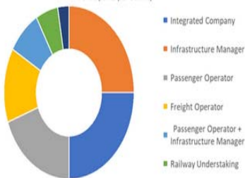
Participants per activity

Чланови UIC добијене резултате користе у побољшању својих стратегија одрживости, идентификујући своје предности и слабости. Поменути индекс помаже да се дође до увида колико железница доприноси постизању циљева Уједињених нација. Статистички показатељи се објављују једном годишње кроз Глобални извештај UIC о одрживом развоју железнице.