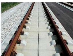
Slab track with flexible noise-reducing rail fixings, built by German company Max Bögl, on the Nürnberg–Ingolstadt high-speed line

Slab track представља колосек без туцаника при чему се традиционална еластична комбинација прагова и туцаника, замењује крутом конструкцијом од бетонских плоча. Поменути производ сматра се новим стандардом за конструкцију пруга намењених за саобраћај возова великих брзина.