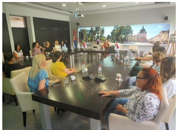
FOKUS GRUPE SA ŽENAMA U INĐIJI I SREMSKOJ MITROVICI