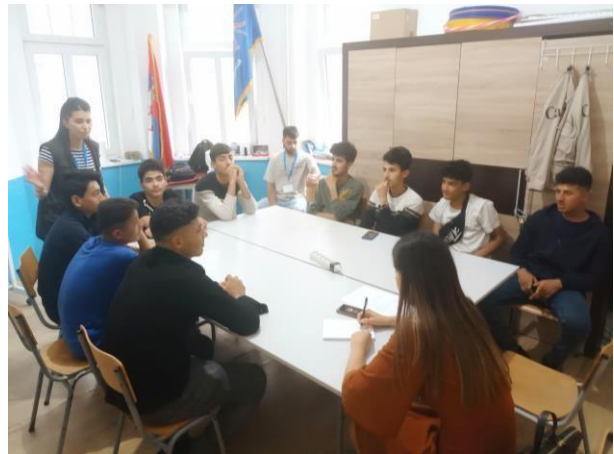
SASTANAK STRUČNOG TIMA I FOKUS GRUPA U VEZI SA UTICAJEM PROJEKTA NA MIGRANTE