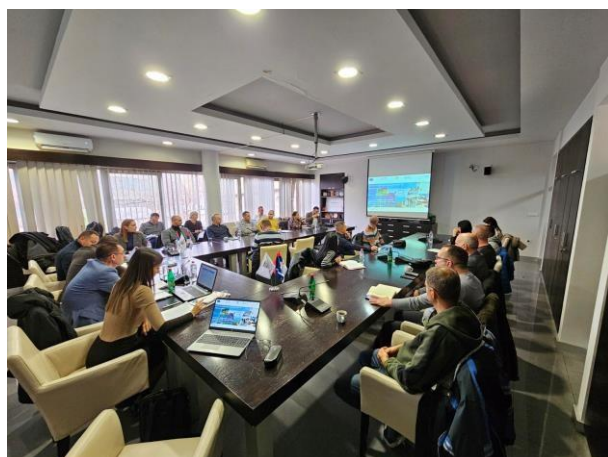
JAVNE KONSULTACIJE U OPŠTINAMA NA KOJE UTIČE PROJEKAT (INĐIJA, SREMSKA MITROVICA)