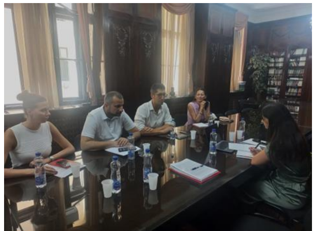
SASTANCI SA ŽELEZNIČKIM SEKTOROM I KOORDINACIONI SASTANAK IZMEĐU IŽS I ČLANOVA EKSPERTSKOG TIMA