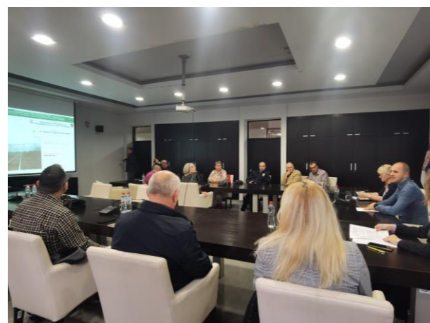
JAVNA PREZENTACIJA NACRTA PROSTORNOG PLANA PODRUČJA POSEBNE NAMENE