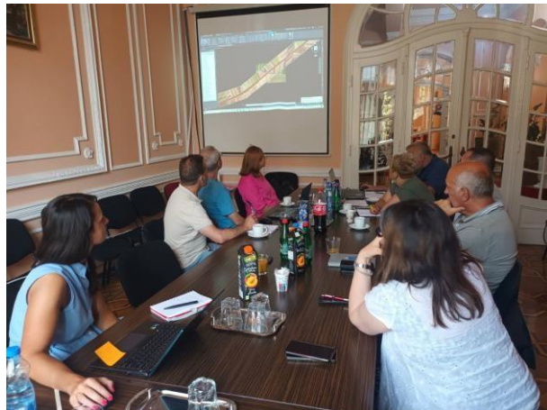
SASTANCI U OPŠTINAMA NA KOJE UTIČE PROJEKAT (ŠID, RUMA)