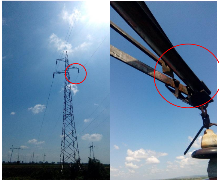
Фотографија 1: Оштећена конзола фазе "8"