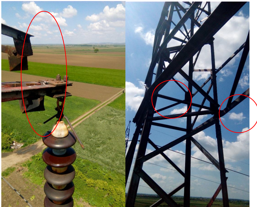
Фотографија2: Покидани варови

Фотографија 3: Савијени доњи појасни штапови конзоле на месту везе са телом стуба